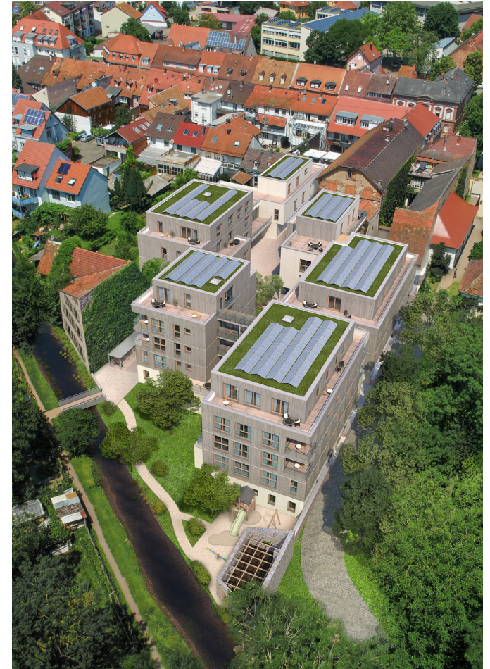
© 3dModell sutter 3 | Visualisierung von GD90