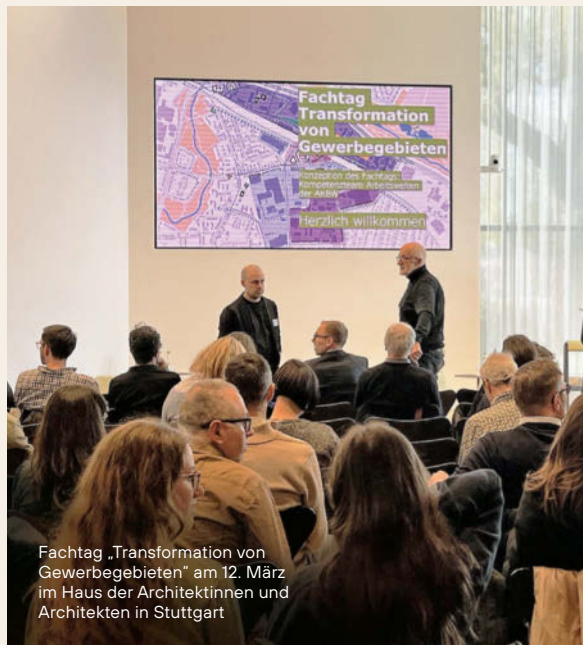
Fachtag „Transformation von Gewerbegebieten“ am 12. März im Haus der Architektinnen und Architekten in Stuttgart

Gewerbegebiete: Industrial Village statt monofunktionaler Strukturen