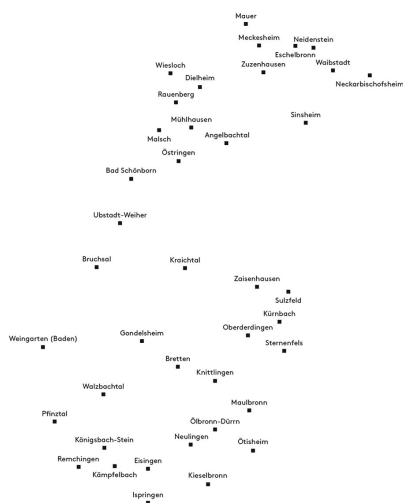
Gebietskulisse des Auszeichnungsverfahrens Baukultur Kraichgau

Geographie am Karlsruher Institut für Technologie haben sich je einen Aspekt rausgepickt und sich ausgiebig mit der Thematik eines nachhaltigen Karlsruhes befasst. Neben Kurzvorträgen zu den einzelnen Themen, gibt es auch eine Podiumsdiskussion, an dem jeder herzlich dazu eingeladen ist, daran teilzunehmen. Für Interessenten gibt es zudem einen Informationsstand mit weiteren Informationen zum Thema Nachhaltigkeit. Am 12.02.2019 ab 19:00 Uhr im Architekturschaufenster.